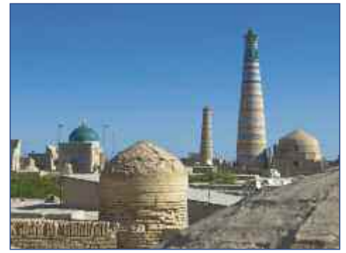
Das Minarett Islam Khodja in Chiwa