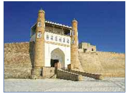
Die Ark-Festung in Bukhara