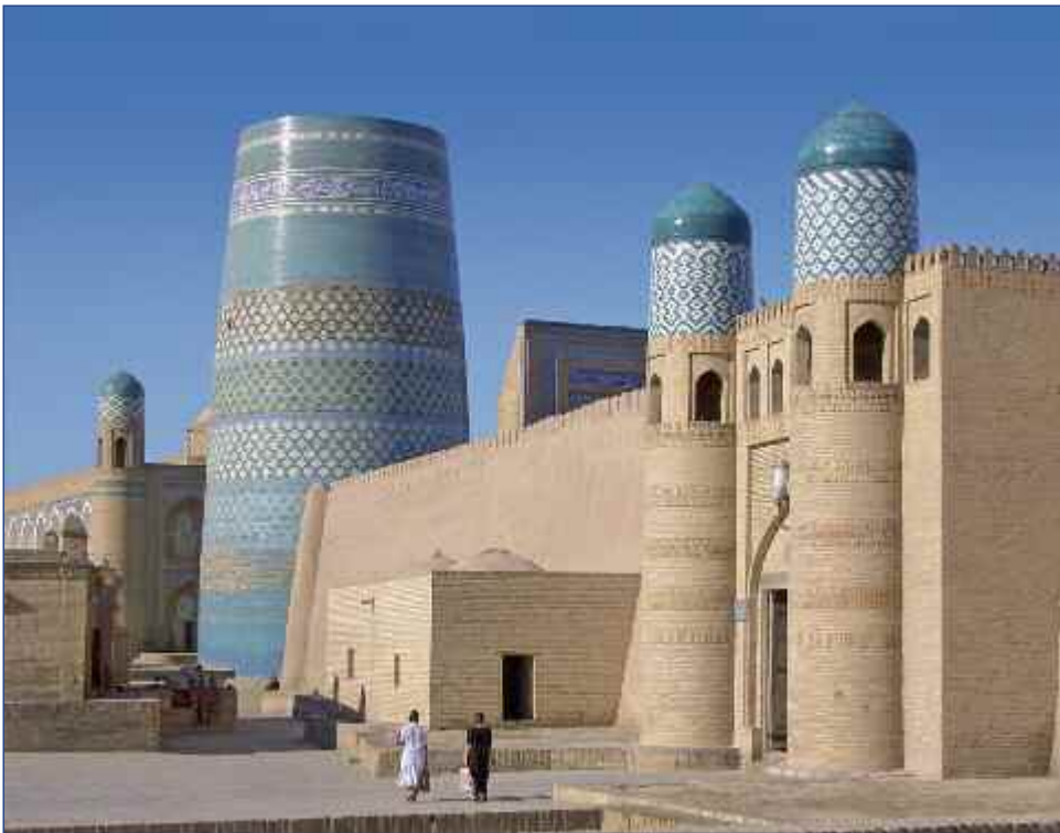
Kalta Minor in Chiwa