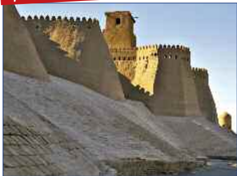
Die Stadtmauer von Chiwa