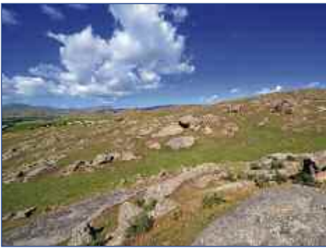
Ihre Reise führt Sie entlang grandioser Landschaften