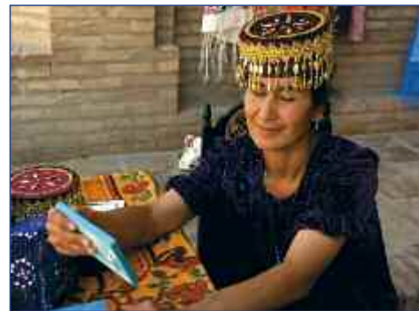
Traditionen werden bewahrt

19.04. BIS 26.04.2012 • FLUG AB/AN FRANKFURT • AB € 1.295,- P.P. IM DZ