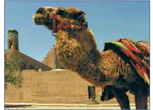
Transportmittel in der Wüste: Reitkamel

reisen Sie am Abend zurück nach Samarkand (voraussichtliche Zugfahrzeiten: Hinfahrt 06:20 - 10:00 Uhr, Rückfahrt 18:20 - 22:00 Uhr).