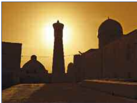
Sonnenuntergang über Bukhara