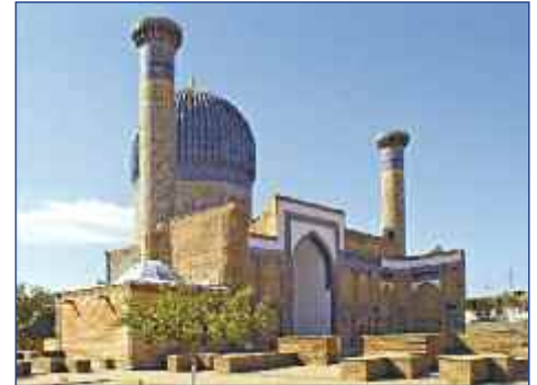
Gur Amir Mausoleum

S eit 2000 Jahren verbindet die sagenumwobene Seidenstraße China mit dem Abendland. Allein ihr Name weckt Träume von Karawanen, kostbaren Stoffen und orientalischen Gewürzen. Im einstigen Reich Dschingis Khans sind die Zeugen der Vergangenheit noch lebendig: Prachtvolle Bauwerke mit kunstvollen Ornamenten und Mosaiken prägen das Bild des antiken Samarkand, typisch islamische Architektur ist in Bukhara zu finden. Abseits der Städte fasziniert eine außergewöhnliche Landschaft. Verlassene Karawanseereien liegen in der großen Wüste Kizilkum, die von einem der längsten Flüsse Zentralasiens – dem Amudarja - begrenzt wird. Überall trifft man auf eine schier unglaubliche Gastfreundschaft! Noch ist die Seidenstraße ein Geheimtipp für Reisende. Entdecken Sie hier den unverfälschten Orient mit all seiner Magie und Mystik!