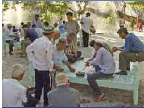
Orientalische Lebensart ...